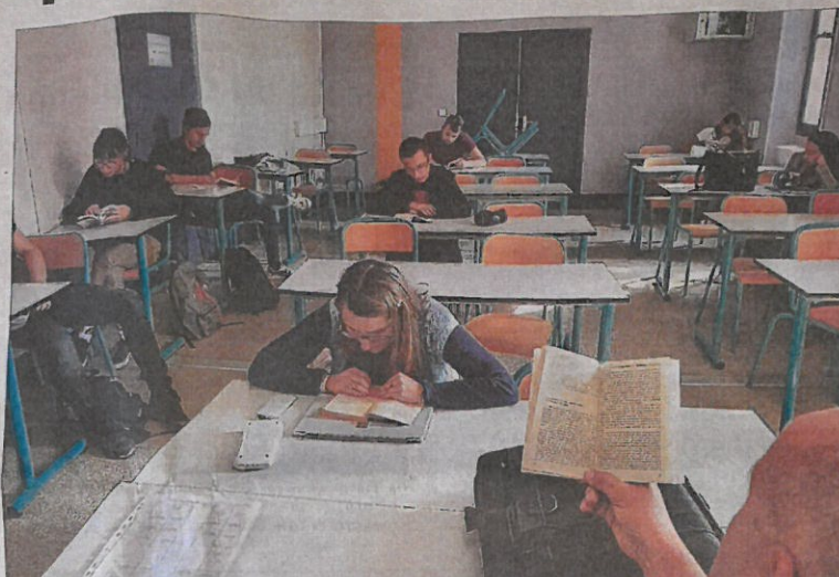
Depuis la rentrée, chaque vendredi à la même heure, le temps s'arrête au lycée des Gorges pour une pause lecture de quinze minutes. C'est le dispositif "Silence on lit !".

Le concept "Silence on lit !", porté par l'association éponyme, a déjà essaimé dans de nombreux établissements scolaires en France et à l'étranger. « J'ai entendu parler de ce dispositif par une collègue qui travaillait au lycée Emmanuel-Mounier de Grenoble, où il était déjà mis en place. Je trouvais l'idée intéressante, j'en ai donc parlé à l'équipe pédagogique et à la direction